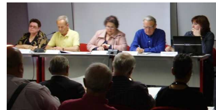
Assemblée Générale - 23 avril 2009

Dans le même temps, nous préparons activement le Forum des Associations des 26 et 27 septembre avec une ouverture sur le thème de la Tolérance le vendredi 25 en soirée. (voir les interviews pages 2 et 3).