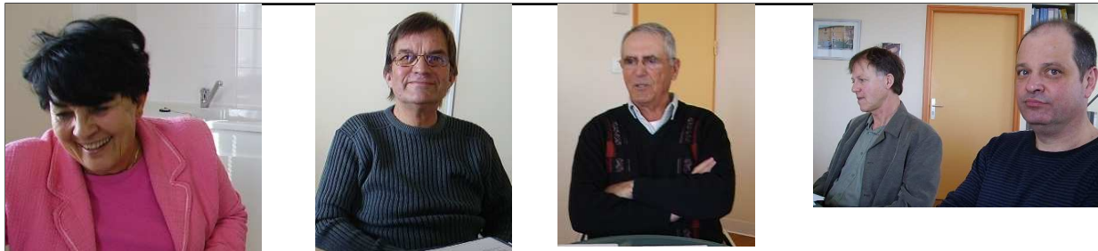
Ils sont cinq autour de la table à parler de tolérance